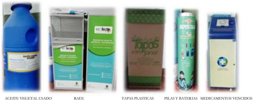
Figura 6. Puntos de acopio residuos especiales – ALSC

La compra y ubicación de los diferentes puntos ecológicos, estuvo acompañada de la gestión para ser punto de acopio y almacenamiento temporal de residuos especiales, tales como: Residuos de Aparatos Eléctricos y Electrónicos-RAEE, pilas y baterías, aceite vegetal usado, punto azul para medicamentos vencidos, tapas plásticas para la Fundación SANAR y el acopio de plásticos flexibles dentro de botellas PET para la elaboración de madera plástica, iniciativa denominada “llena una botella de amor”, todos, para ser dispuestos posteriormente por empresas certificadas y autorizadas por la autoridad ambiental del distrito.