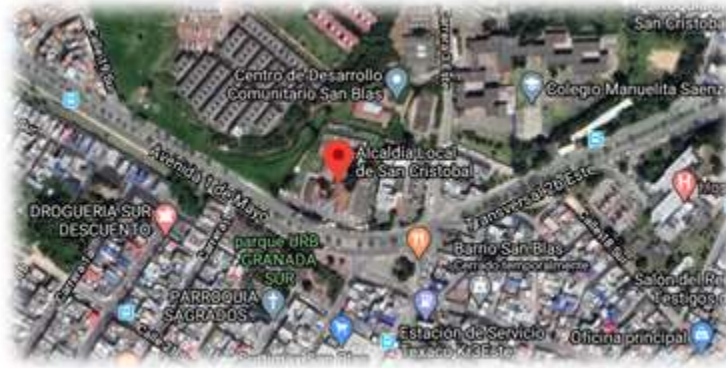
Figura 1. Ubicación Alcaldía Local de San Cristóbal Sede Administrativa