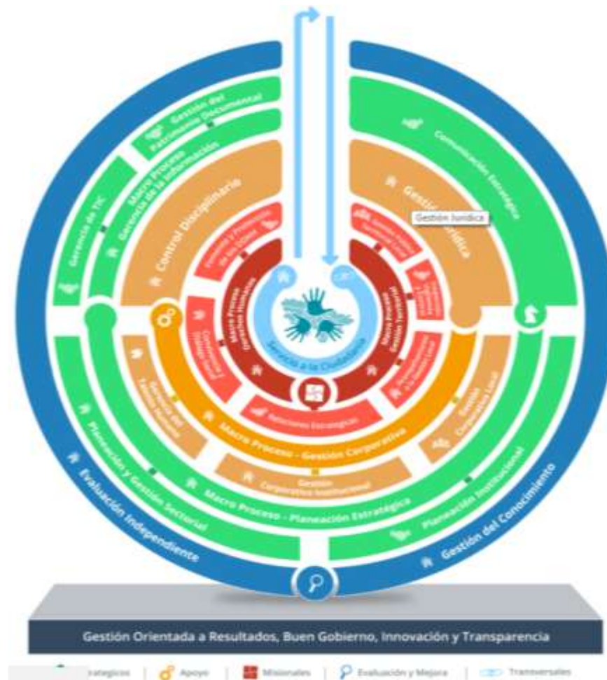
Figura 5. Sistema de Gestión de la Secretaría Distrital de Gobierno “MATIZ”, 2020.