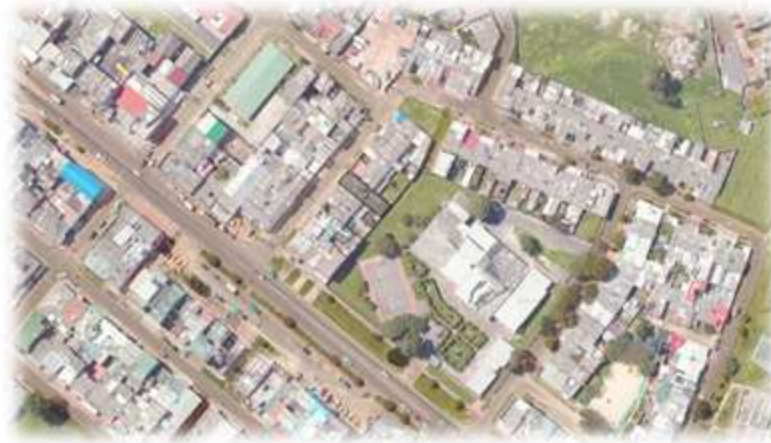
Figura 2. Ubicación Alcaldía Local de San Cristóbal Sede Casa de la Juventud