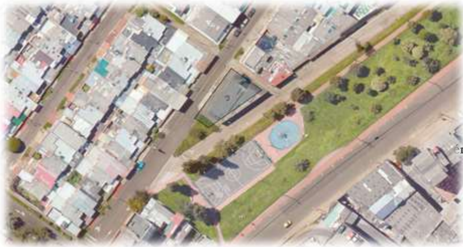
Figura 3. Ubicación Alcaldía Local de San Cristóbal Sede Casa de la Juventud