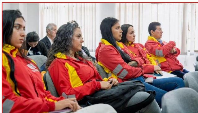
FUNCIONARIOS ALCALDIA LOCAL DE SAN CRISTÓBAL